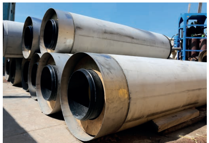
Склад временного хранения труб для микротоннелирования Perfect Pipe на стройплощадке

идеально подходят для монтажа методом продавливания, имея решающее преимущество для бестраншейной укладки: высокая скорость монтажа за счет простого и быстрого выполнения соединений в стартовом котловане.