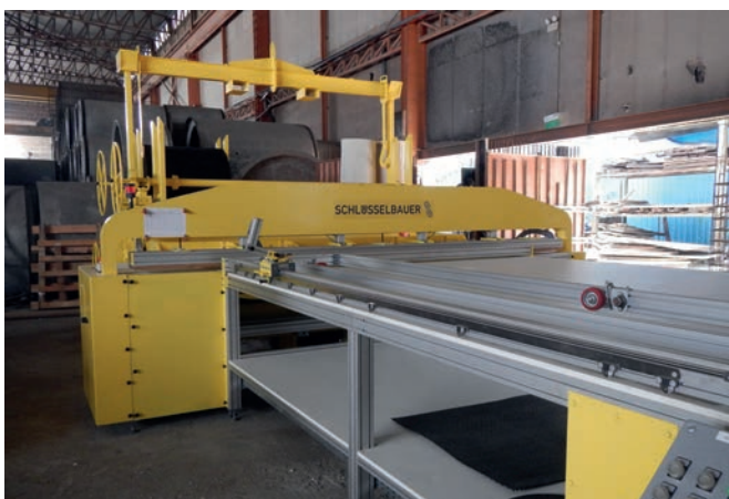
Резка на участки требуемой длины и автоматическая сварка футеровочного вкладыша в соответствии с требуемым номинальным внутренним диаметром