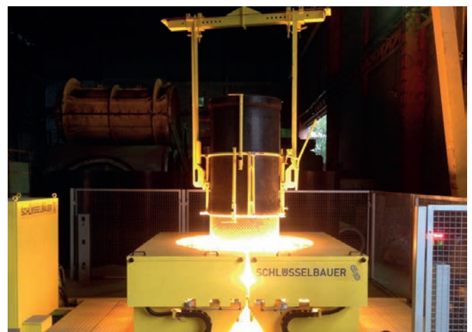
Термопластичное формование краев вкладыша для последующей установки коннекторов