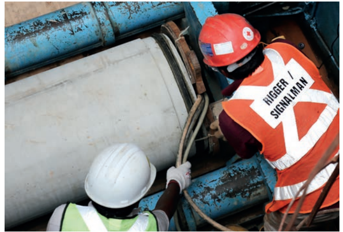
Подготовка оборудования для проходки