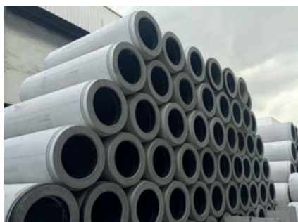
Склад труб для микротоннелирования Perfect Pipe на главном заводе Vilcon в Сингапуре

совершенствуя свою продукцию. Еще в 1980-х гг. традиционные железобетонные трубы стали футеровать коррозионно-стойким пластиком в целях увеличения срока службы канализационных сетей. И если в прошлом в Сингапуре были популярны относительно хрупкие керамические канализационные трубы, то сегодня на первое место вышли прочные железобетонно-пластиковые композитные трубы, которые демонстрируют непревзойденную стойкость ко всем типам агрессивных химических сред.