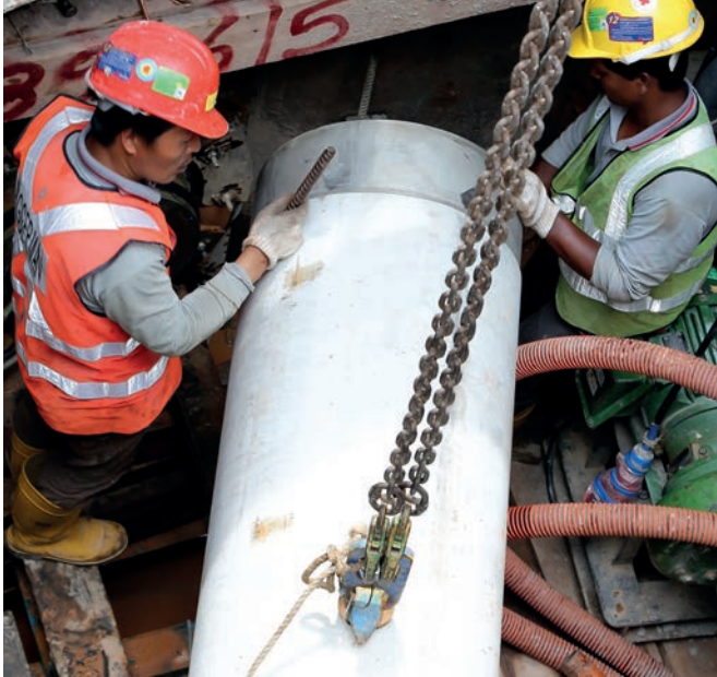
Установка трубы в стартовый котлован