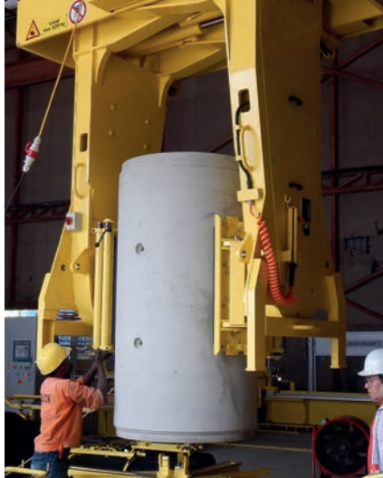
Безопасная выгрузка при помощи захвата