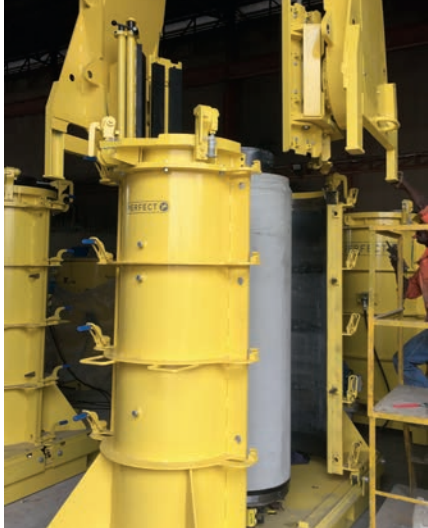
Распалубка готовой трубы для микротоннелирования